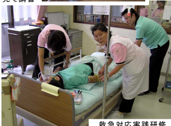
救急対応実践研修