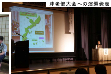
沖老健大会への演題発表