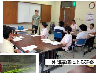
外部講師による研修