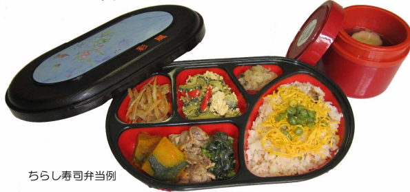
ちらし寿司弁当例