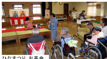
ひなまつり お茶会