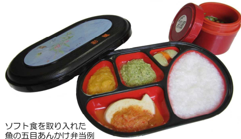
ソフト食を取り入れた魚の五目あんかけ弁当例

※ スープ容器以外、レンジ対応容器ですので、容器ごと温めて、お召し上がりいただけます。